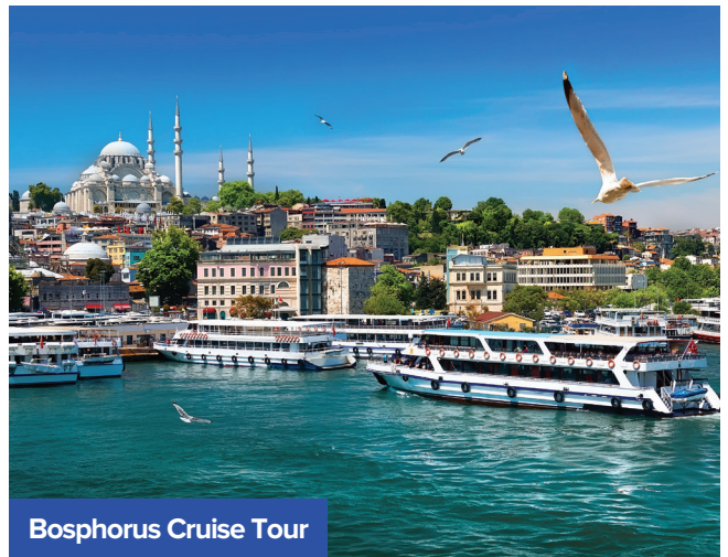
Bosphorus Cruise Tour