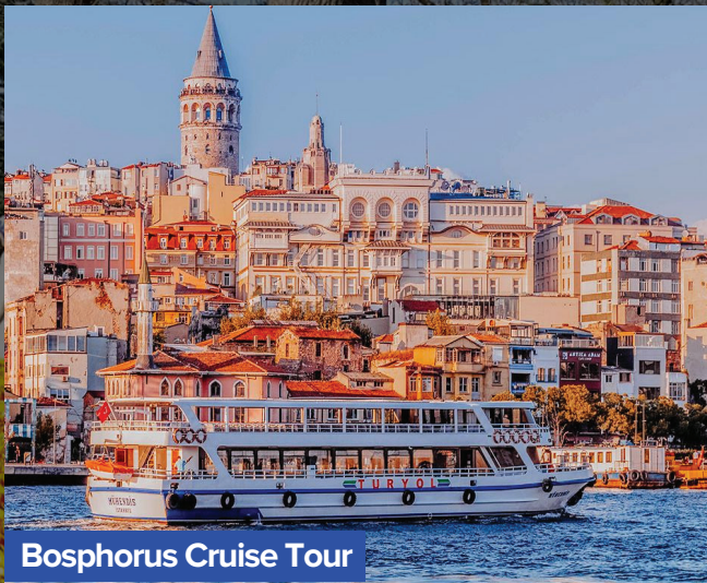
Bosphorus Cruise Tour