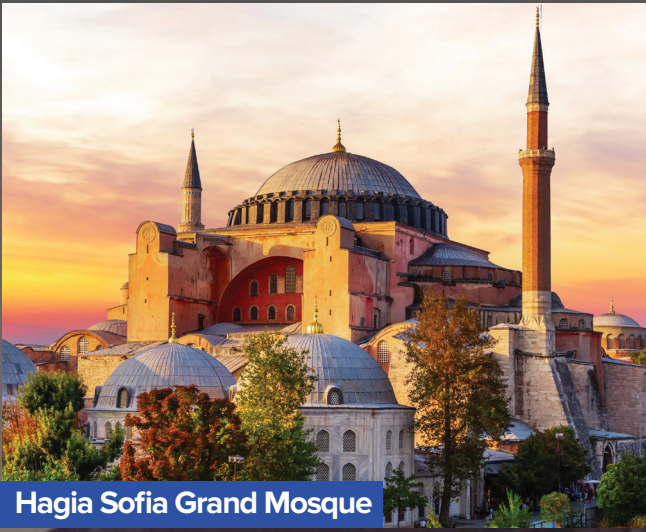
Hagia Sofia Grand Mosque