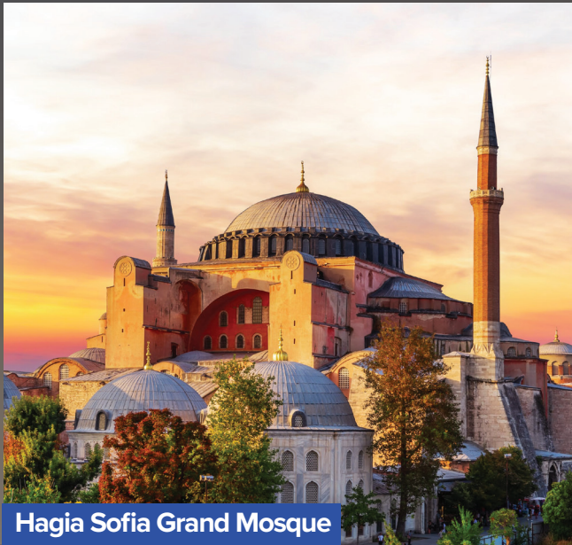
Hagia Sofia Grand Mosque