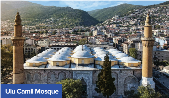
Ulu Camii Mosque