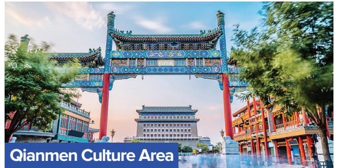
Qianmen Culture Area