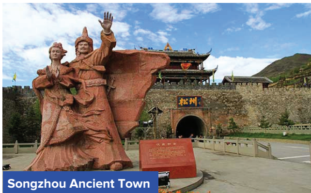
Songzhou Ancient Town