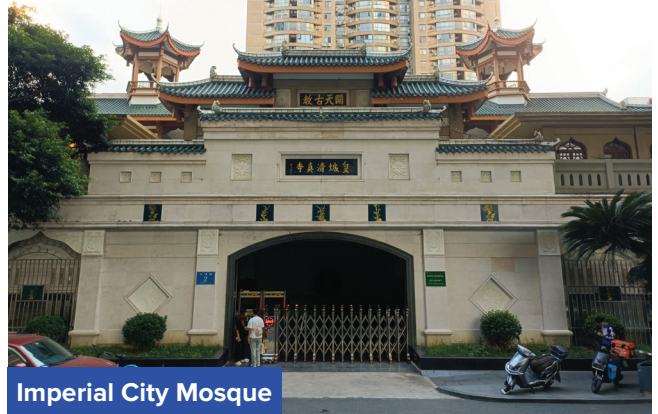
Imperial City Mosque