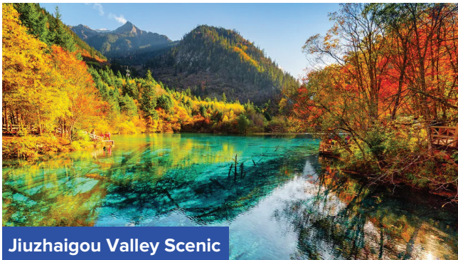
Jiuzhaigou Valley Scenic