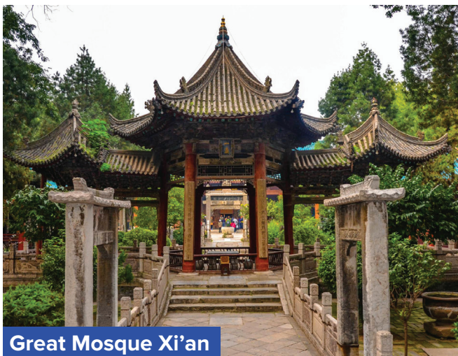
Great Mosque Xi'an