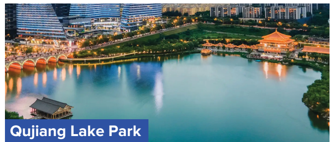
Qujiang Lake Park

• Qujiang Lake Park - Taman Tasik Qujiang kaya dengan sejarah dan budaya. Kawasan ini pernah menjadi tempat peristirahatan bagi para kaisar zaman dinasti Tang dan kini, elemen-elemen sejarah tersebut masih dapat dilihat melalui reruntuhan, patung, dan arsitektur yang tersebar di seluruh taman. Ia juga sering menjadi tuan rumah untuk berbagai acara budaya dan festival, termasuk perayaan Festival Lentera dan pertunjukan musik atau tarian tradisional, menambahkan kekayaan pengalaman bagi pengunjung.