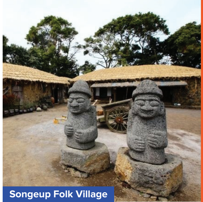
Songeup Folk Village