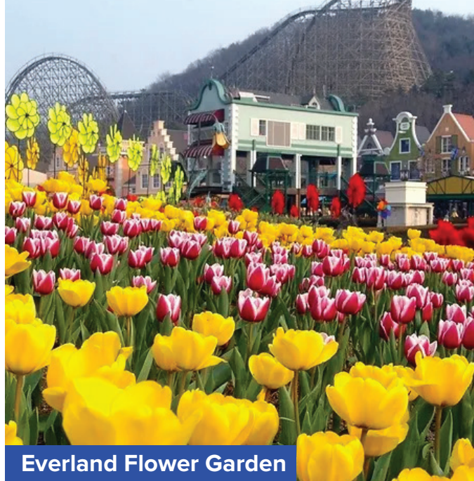
Everland Flower Garden