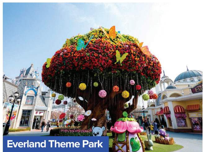
Everland Theme Park