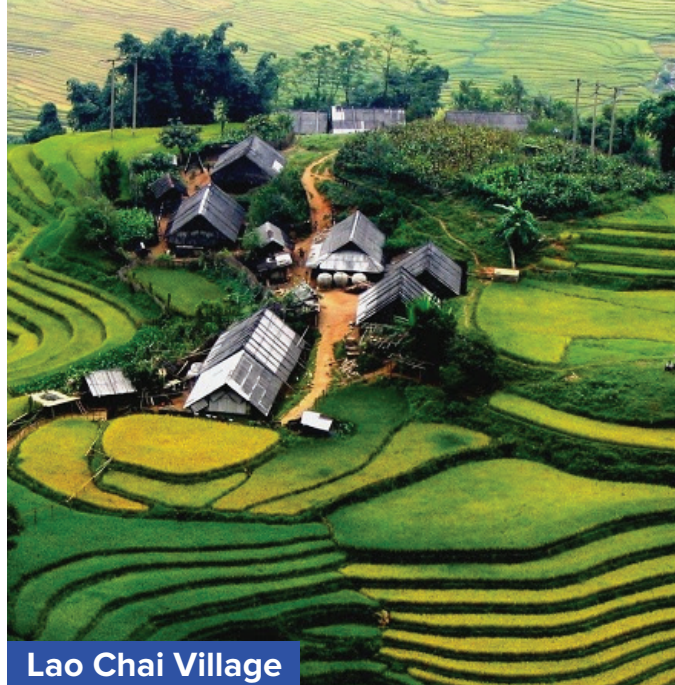
Lao Chai Village