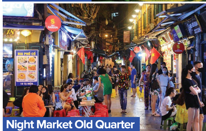
Night Market Old Quarter