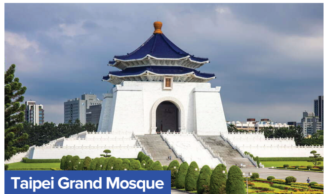
Taipei Grand Mosque