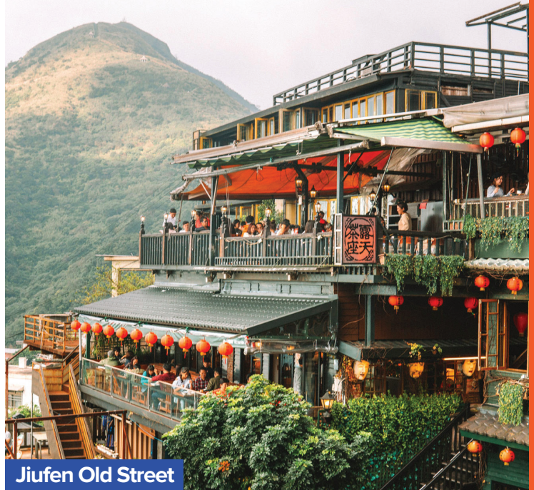
Jiufen Old Street