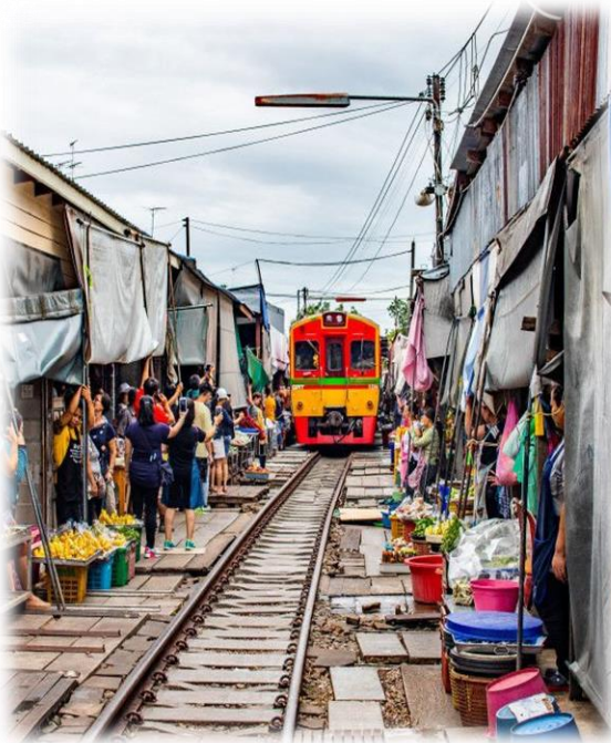
Maeklong train market