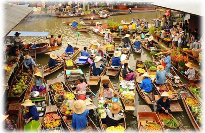
Floating Market (Damnoen Saduak)