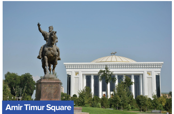
Amir Timur Square

• Amir Timur Square: Dataran yang dibina pada 1882 dan di tengahnya terdapat tugu pemerintah agung Timur dan berdekatan sini juga terletaknya Amir Timur Museum yang dibina pada 1996.