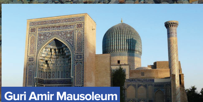
Guri Amir Mausoleum