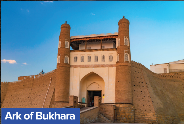
Ark of Bukhara