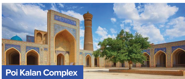
Poi Kalan Complex